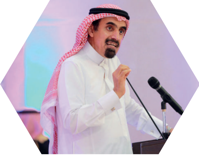
معالي الدكتور :

ولعلّ الاسم الذي يحمل هذا الصرح ، وهو ( التعلم ) يفسر أبرز ملامح فلسفتنا ، فالتعلم لا التعليم هو محور العمل هنا فالطالب لدينا يتعلم ذاتيا لا بالتلقين ، ويتعود على إطلاق قدراته واكتساب المهارات الجديدة ومهارات التفكير ، والمهارات الحياتية ، وبهذا السلوك العصري في دمج الطالب بالمعرفة يحصل الإبداع وينهض الوطن بعقول أبنائه ليكون هذا الطالب صالحا لنفسه وأسرته ومجتمعه ووطنه. وهذه الفلسفة التي بنينا عليها مدارس التعلم، تنطلق من استقرار جوانب القصور في واقع التعليم العام، مسترشدة بأفضل التجارب الدولية، لتقديم سياسة تعليمية عصرية، تشمل المناهج والوسائل والآليات وعلى هذا بنينا رؤيتنا ورسالتنا وأهدافنا ، لنكون بإذن الله بداية التحول نحو نهضة تعليمية حقيقية، أقول هذا مدركا مستوى هذا التحدي ، والجهد اللازم لتحقيقه.